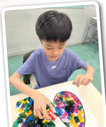
嘩！睇吓隻復活蛋整得幾靚！！