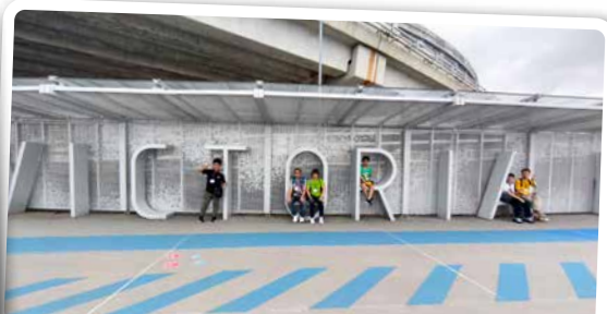
教大家維港英文 ~ Victoria Harbour