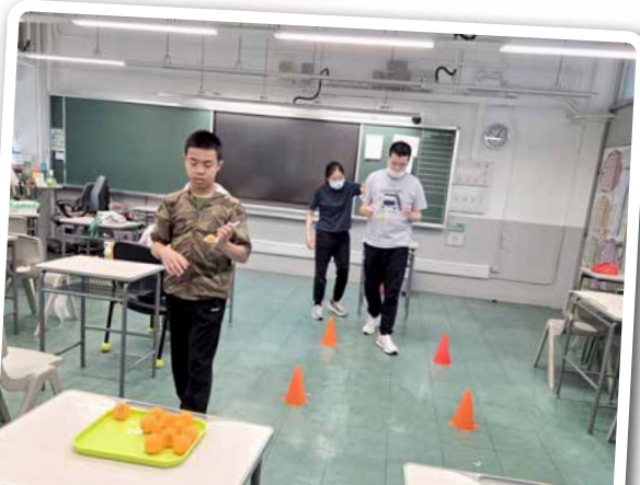
控球運動 - 睇吓我地邊個快D完成？